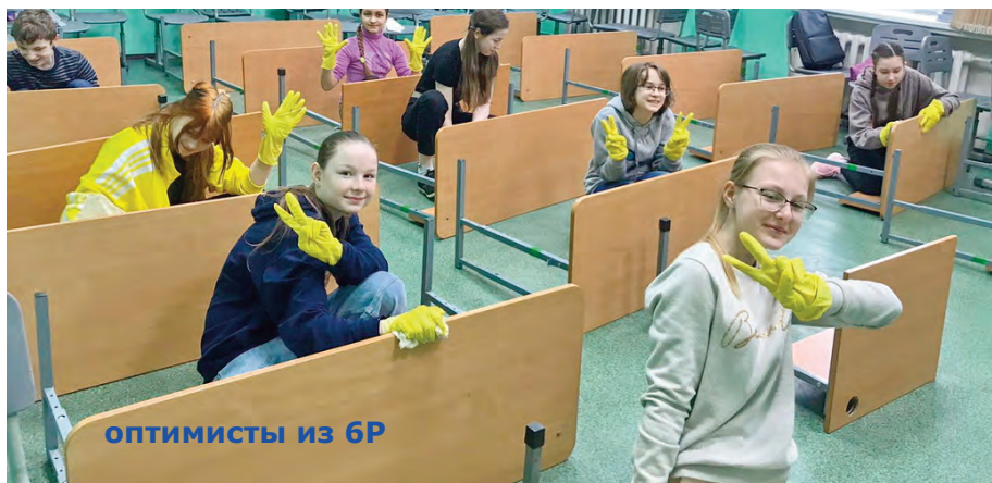
оптимисты из 6Р