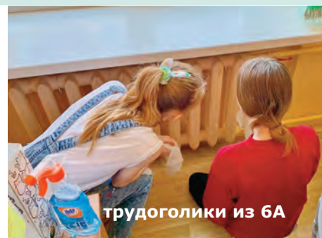
трудоголики из 6А