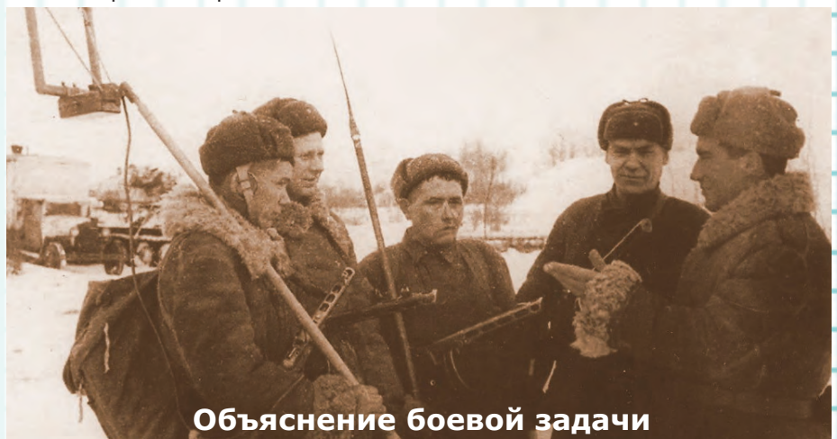
Объяснение боевой задачи