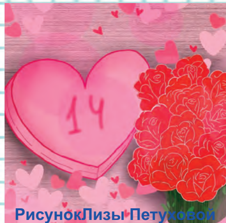
Рисунок Лизы Петуховой